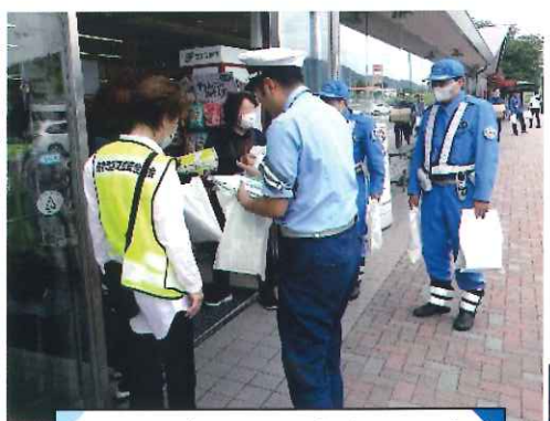
7月・養老SAで啓発活動