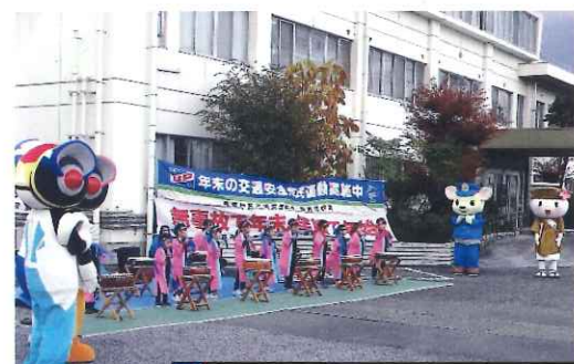
12月・年末特別警戒出発式参加。終了後、啓発活動(カネスエ・トミダヤ)