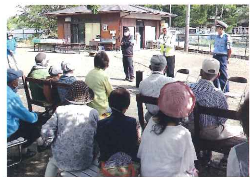
5月・ペタンク大会で高齢者向け 啓発活動（広幡自治会館）