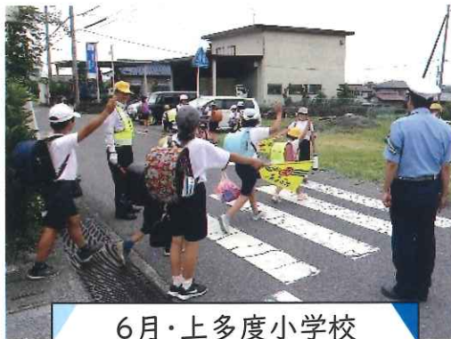
6月・上多度小学校 下校時交通安全指導