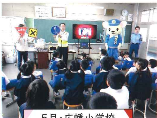
5月・広幡小学校 交通安全教室