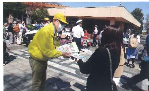
4月・春の全国交通安全運動& 防災フェア（こどもの国）