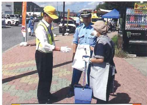
9月・養老SAで啓発活動