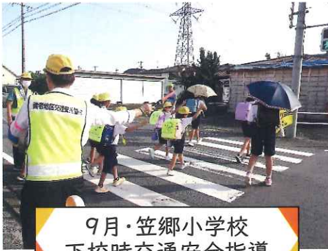
9月・笠郷小学校 下校時交通安全指導