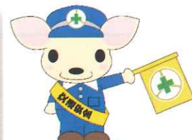
【こあんちゃん】 岐阜県交通安全協会 マスコットキャラクター

令和6年の主な活動を紹介します。 朝の街頭監視をはじめ各種活動に参加いただいた 役員の皆様ご協力ありがとうございました！