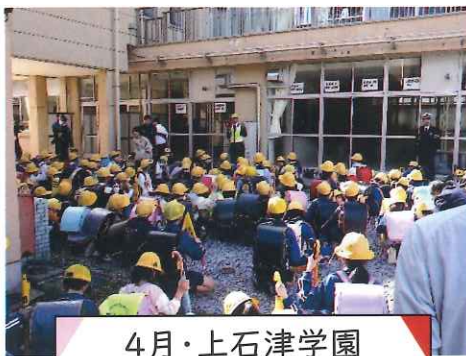
4月・上石津学園 下校時交通安全指導