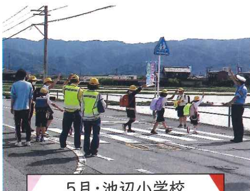
5月・池辺小学校 下校時交通安全指導