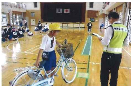
11月・養北小学校5年生 自転車免許講習会