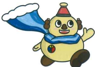
【ようたん】 養老警察署 マスコットキャラクター