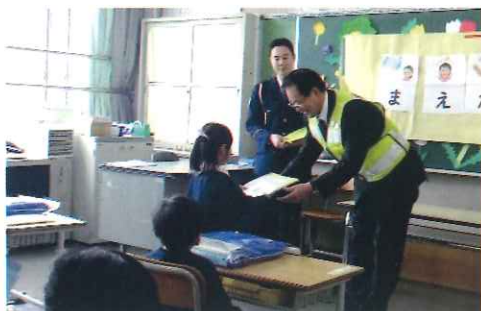
4月・新入学児童全員に 反射材付きランドセルカバー贈呈