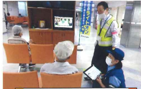
9月・高齢者向け啓発活動 (西美濃厚生病院)