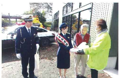
12月・養老SAで啓発活動