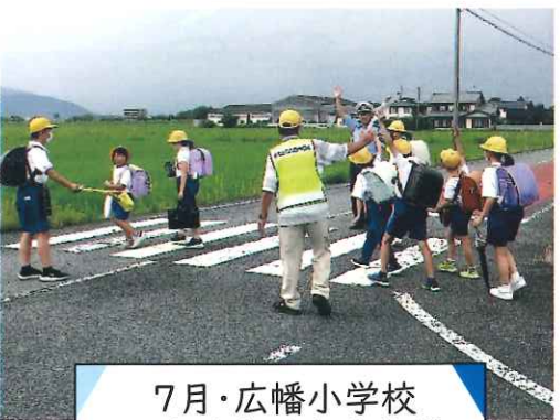
7月・広幡小学校 下校時交通安全指導