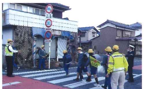
11月・養老小学校 下校時交通安全指導