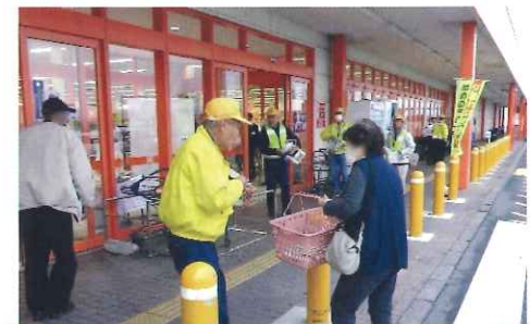
11月・夕暮れ時の県内一斉 啓発活動(ビッグ養老店)