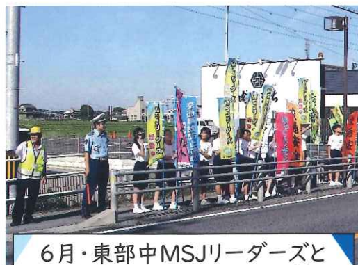
6月・東部中MSJリーダーズと 人波活動（笠郷郵便局前）