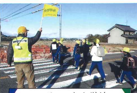
12月・日吉小学校 下校時交通安全指導