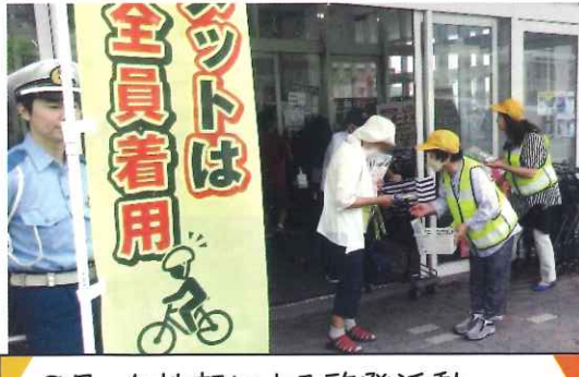
9月・女性部による啓発活動 ～手作りマスコット配布(トミダヤ)