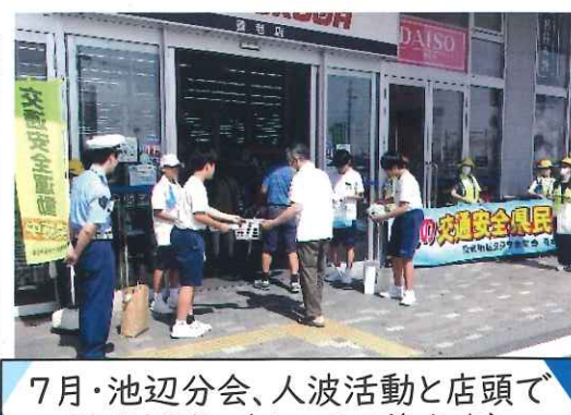
7月・池辺分会、人波活動と店頭で 啓発活動（オークワ養老店）