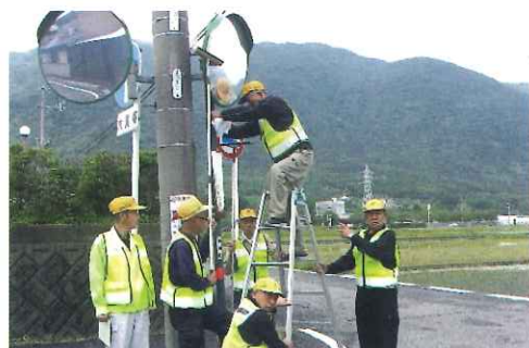
カーブミラー清掃・点検(各分会)