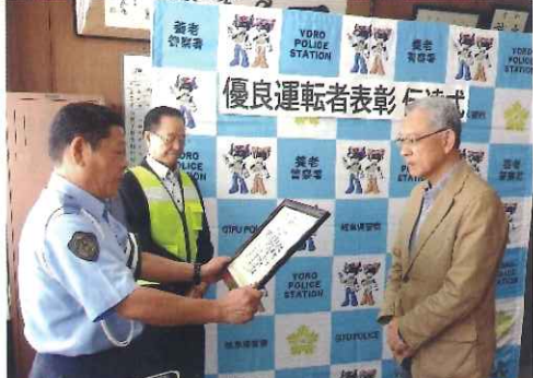
9月・優良運転者表彰伝達式