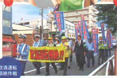
飲酒運転根絶作戦