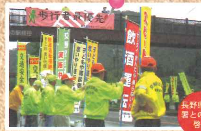
長野県木曾署との合同啓発