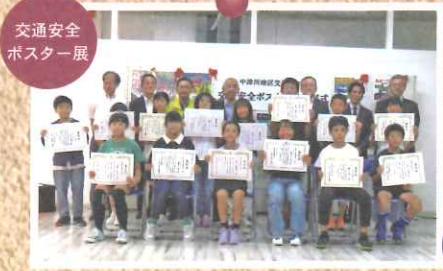
交通安全ポスター展