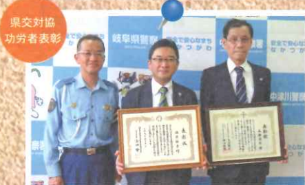
県交対協 功労者表彰