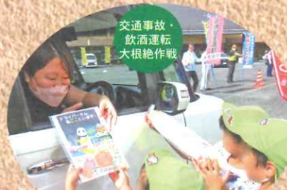
交通事故・飲酒運転 大根絶作戦