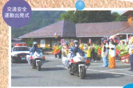
交通安全運動出発式