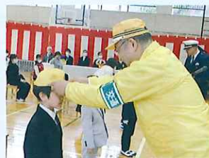
▲高齢者交通安全大学校