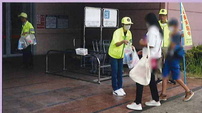
ラスパ御嵩店にてチラシ等を配布し交通安全を呼びかけました