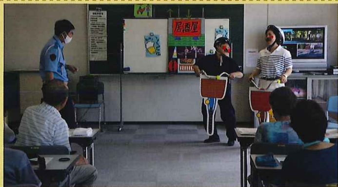
可児市交通指導員による【自転車安全利用】の寸劇

このチラシは、皆さまからご協力いただきました交通安全協力金等により作成しています