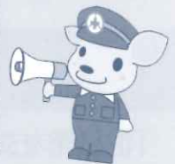
7/13 竹原地区 交通指導所