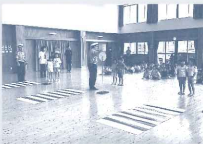
7/9 七夕交通安全教室 みなみこども園