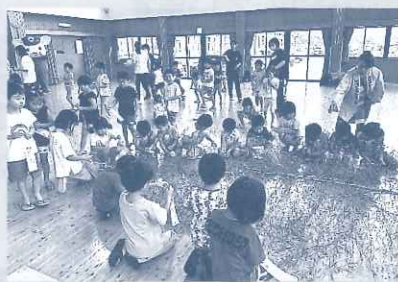
年長さんたちが短冊に願い事を 書いてくれました。