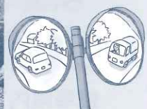
7/21 上原地区 カーブミラー清掃