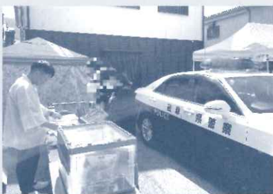
7/13 天領朝市での啓発活動