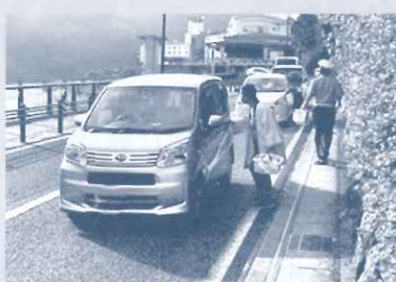
7/20 薄暮時の街頭啓発活動(下呂大橋東詰め交差点)