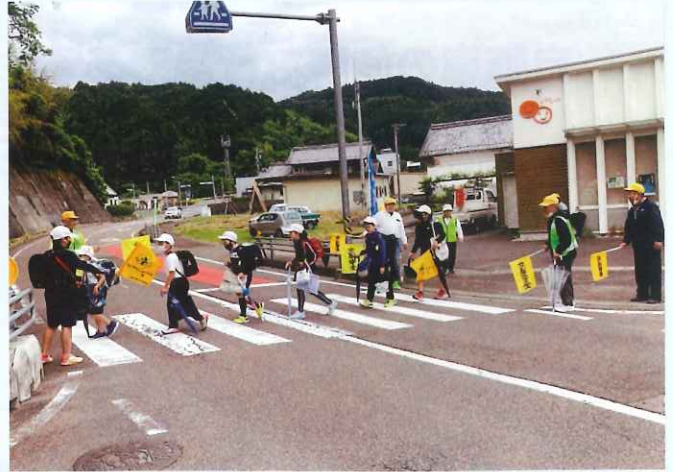
(七宗支部) 子供達の通学を見守りました。