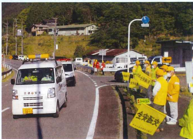
春の交通安全運動 (白川支部) 広報車を使用して啓発及び注意喚起をしました。