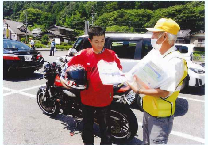
バイク運転者への広報（七宗支部） 道の駅ロックタウン七宗で、バイク運転者に交通安全広報を行いました。