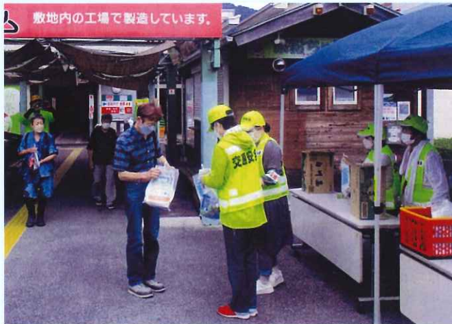
夏の交通安全県民運動（白川支部） 道の駅に於てチラシ等を配布して啓発活動を行いました。