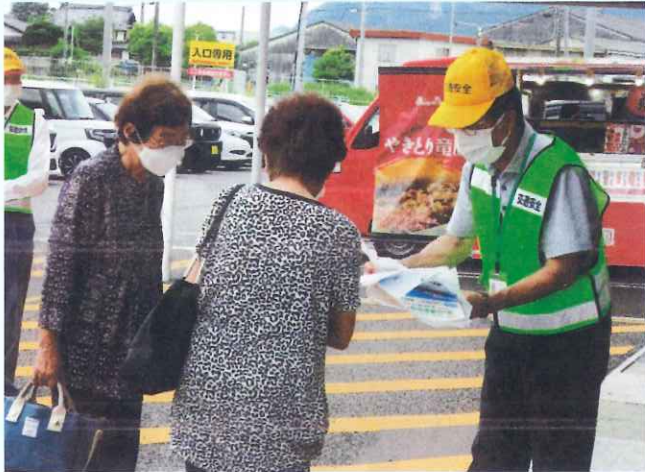
チラシ・啓発品の配布 (坂祝支部)