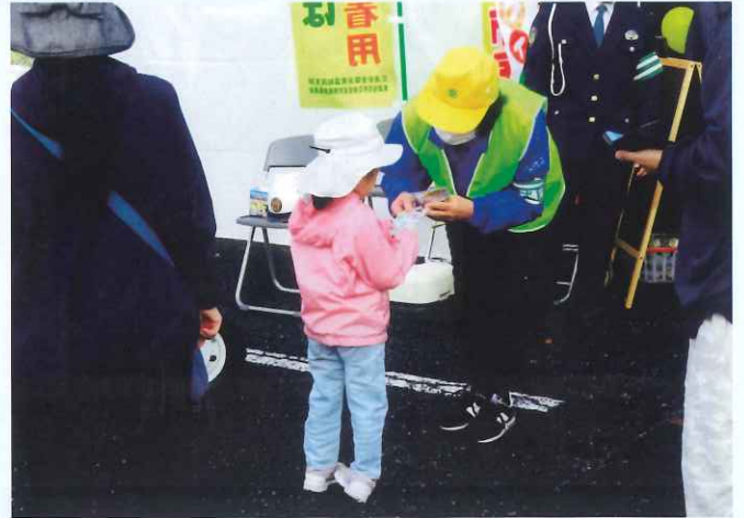
ぎふ清流里山公園 美濃加茂市民まつりで啓発品を配布しました。