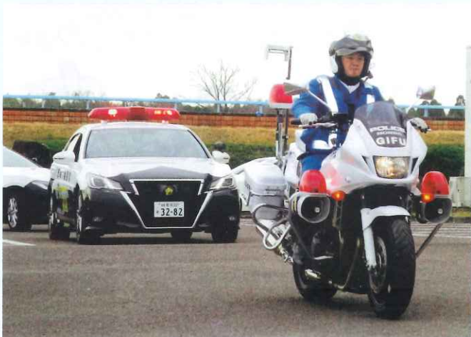
年末の交通安全県民運動 出発式