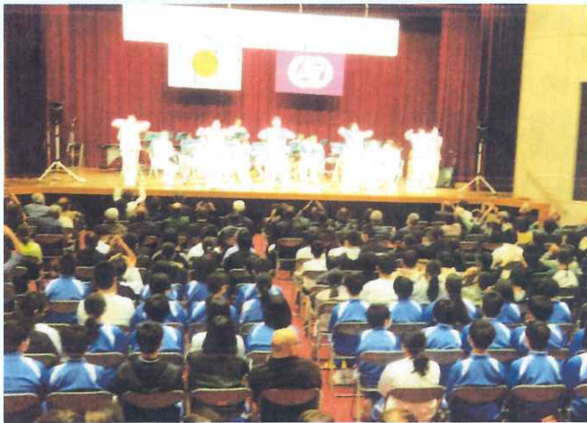
高齢者大学校閉校式 (川辺支部)

県警音楽隊・川辺町の6年生・川辺中学生も参加し音楽を楽しむと共に「交通安全宣言」を行いました。