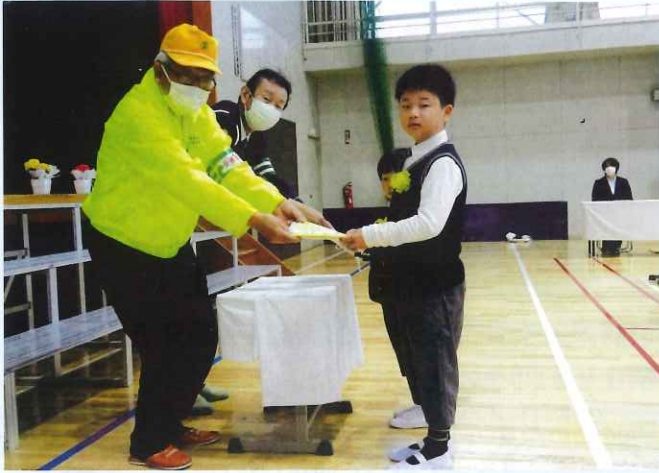
ランドセルカバーの贈呈 (各支部) (写真は川辺支部) 管内の新1年生にランドセルカバーを贈りました。