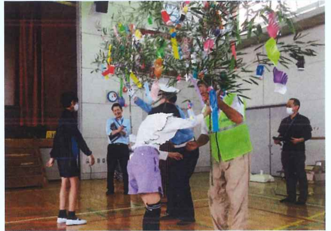
交通安全の願いを込めた七夕飾り（美濃加茂支部） 太田小学校6年生の子供達から贈られた七夕飾りを加茂署をはじめ市内5ヶ所に飾りました。