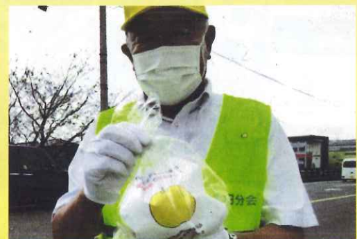
秋の全国交通安全街頭指導所で「事故梨」を配布

交通安全協会は、地域の方々に協力してもらって活動ができるんだね！！ これからも、ご協力頂いたお金は地域の交通安全のために大切にさせていただきます！ こあんちゃんより