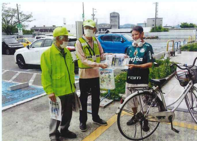
自転車のヘルメット着用努力義務化（美濃加茂支部） チラシを配布して呼び掛けました。