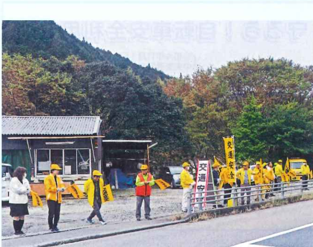
秋の全国交通安全運動 (白川支部)