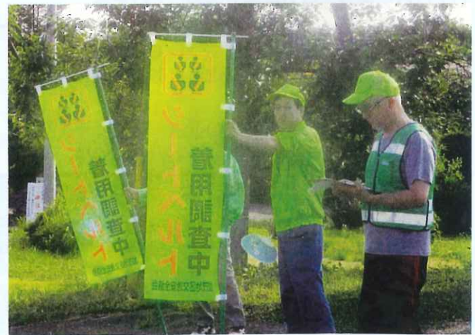
シートベルト着用調査 (八百津支部) 交通安全運動期間中に実施しました。