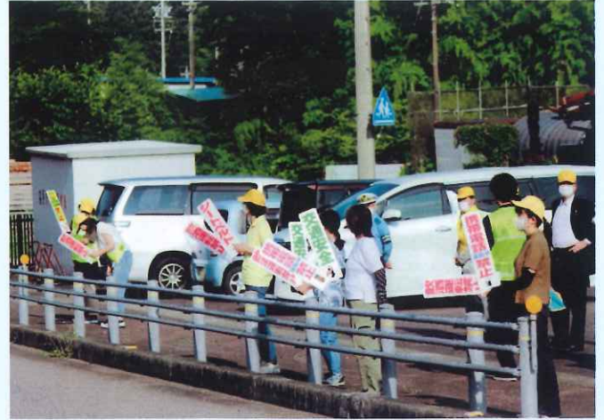
街頭指導所 (東白川支部)