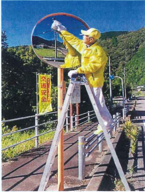
環境整備事業 (各支部) カーブミラーの清掃