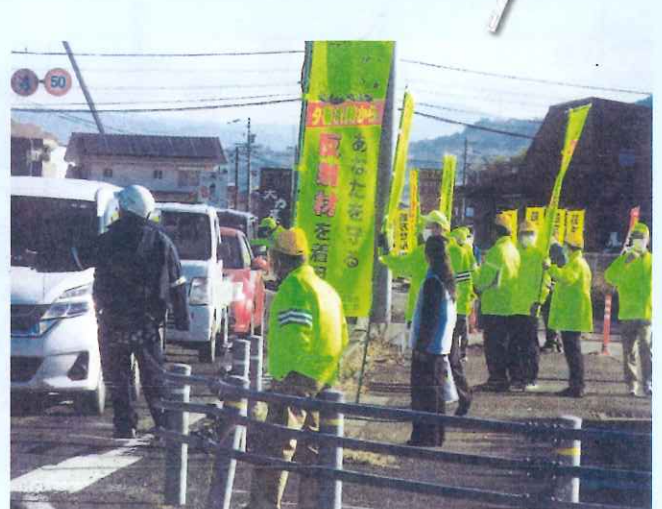
薄暮時の街頭指導 (美濃加茂支部)