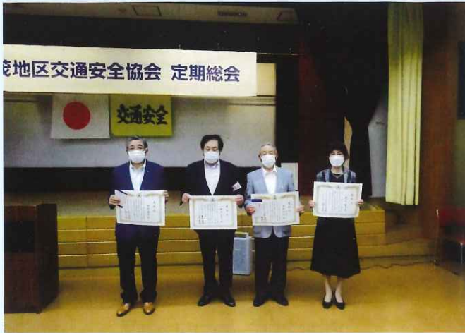
加茂地区交通安全協会定期総会（事務局） 交通安全活動に功勞のあった方を表彰しました。