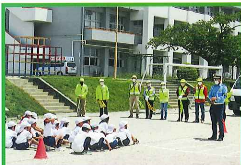
小学校 交通安全教室