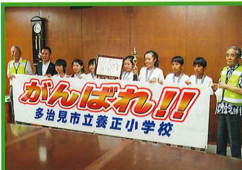
こども自転車全国大会 養正小学校出場