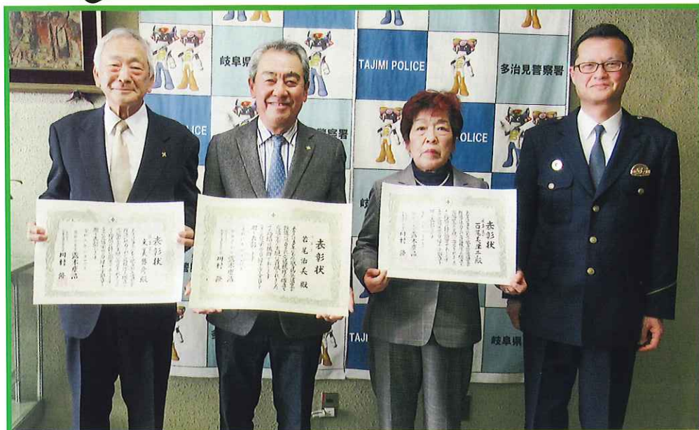
交通栄誉章 「緑十字金・銀章」受章報告

交通安全の輪を広げるために 交通安全協力金のご協力 ありがとうございます 現在、運転免許を保有している皆さんには、 免許更新の際に協力金のご協力をいただき ております。このお金は、交通安全活動に 使わせていただいています。 今後も皆さんのご協力を お願いいたします。