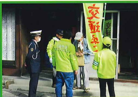
高齢者宅交通安全啓発ポストイン作戦