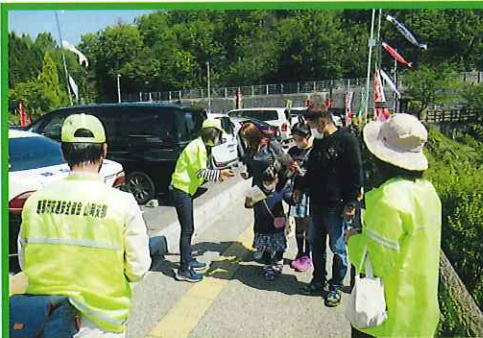
バイクの日 交通安全広報啓発活動