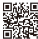
自転車安全利用 啓発動画

「自転車安全利用五則」を守り、自転車利用中の交通事故防止に努めましょう。自転車は原則として車道通行、車道は左側通行、歩道は歩行者優先など、通行方法を守りましょう。