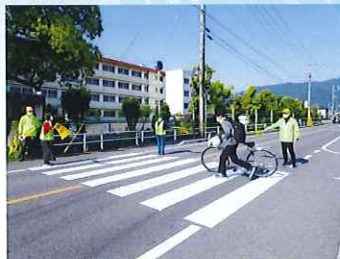
高校生の安全な横断誘導