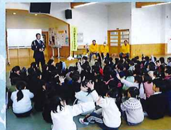
小学校において交通安全教室