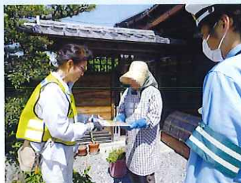
高齢者宅家庭訪問