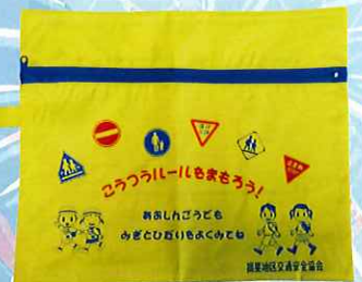
新小学一年生に フリーケースプレゼント