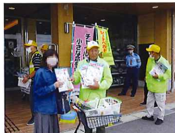
シートベルト・チャイルドシート 着用強調月間活動