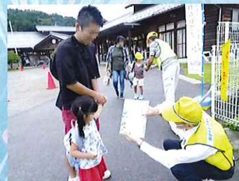
シートベルト・チャイルドシート 着用強調月間活動