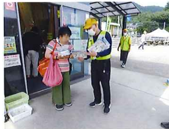
道の駅において、チラシ等の配布