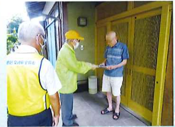
高齢者宅家庭訪問