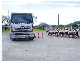
小学校のグラウンドにおいて、 ダンプカーによる交通安全教室