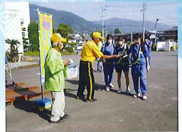
自転車の安全利用広報活動