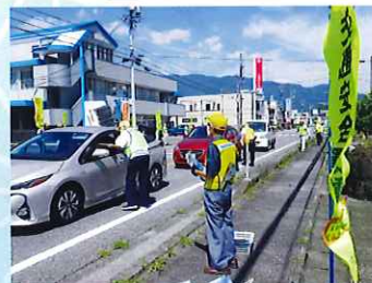
街頭指導所の開設