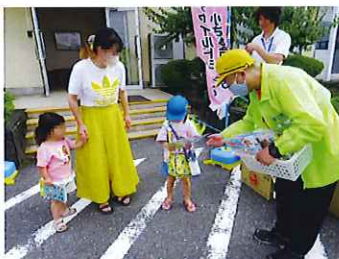
シートベルト・チャイルドシート 着用強調月間活動