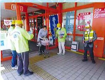
スーパー店頭においてチラシ配布